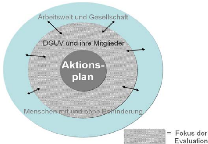
Abbildung: Fokus der Evaluation zur Umsetzung des Aktionsplans der gesetzlichen Unfallversicherung

Die folgende Abbildung verdeutlicht zusammenfassend den Fokus der Evaluation. Ausgehend vom Schwerpunkt der Maßnahmenumsetzung und weiterer Aktionen werden der Grad der Zielerreichung und wahrgenommene Auswirkungen qualitativ erfasst (symbolisiert über die Pfeile).